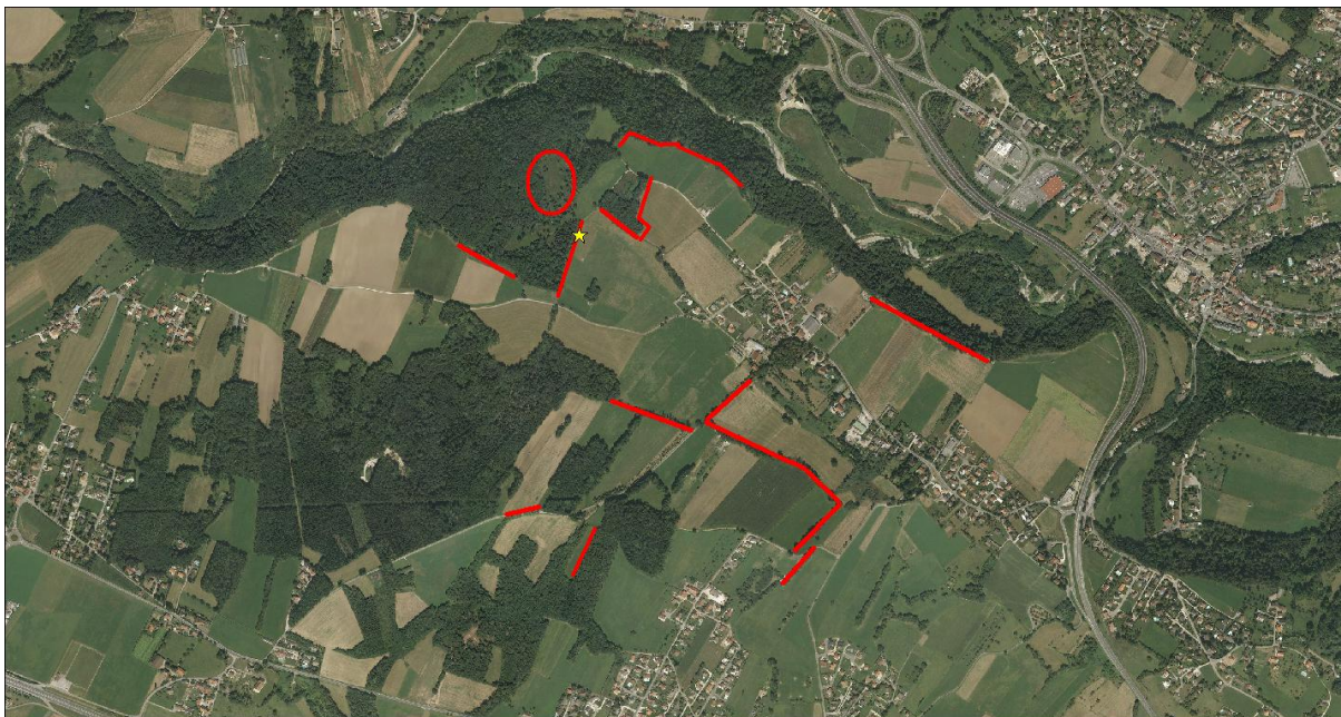
Secteurs de prospection du grand capricorne, en rouge. Présence de l'espèce détectée en 2021, en jaune.